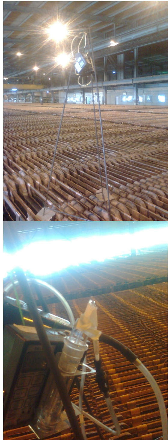
شکل ۱. نحوه برپایی سیستم نمونه برداری در سالن الکترولیز

نظر گرفته شد. شکل ۱ نحوه برپایی سیستم نمونه برداری را نشان می‌دهد.