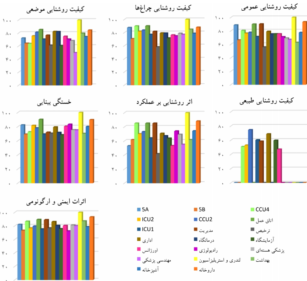
شکل ۱. امتیاز پرسشنامه براساس بخش‌های مختلف بیمارستان و حیطه‌های مختلف پرسشنامه

نتایج ارزیابی روشنایی مصنوعی در بخش‌های بیمارستان یکی از مهمترین فاکتورهای ارزیابی مطلوبیت در هر مکان، متوسط شدت روشنایی در آن محل است.