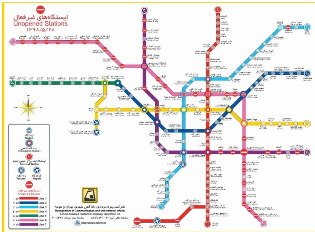
شکل ۱. جدیدترین نقشه خطوط ریلی مترو تهران

شهری و یک شبکه مترو با هفت خط که به وسیله شبکه اتوبوسرانی و تاکسیرانی تکمیل می‌شد ارائه گردید. بر اساس طراحی اولیه متشکل از هفت خط می‌باشد؛ که شش خط آن درون‌شهری و یک خط برون‌شهری (تهران- کرج) می‌باشد (۱۹). در شکل ۱ آخرین نقشه مترو شهر تهران ارائه شده است.