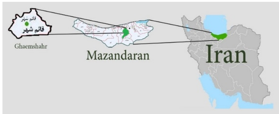
تصویر ۱. نقشه منطقه مورد مطالعه

هویت دو گونه موسکا دومستیکا و لوسیلیا سربیکاتا جهت جداسازی عوامل باکتریایی با استفاده از سرم فیزیولوژی استریل شسته شدند. محلول حاصل از شست و شوی سطح خارجی در سانتریفیوژ قرار داده شد (۲۰۰۰rpm) و رسوب به دست آمده بر روی محیط کشت‌های نوترینت آگار ۱ و بلاد آگار ۲ کشت داده شد. محیط‌های کشت به مدت ۲۴ ساعت در دمای ۳۷ درجه سانتی‌گراد در انکوباتور نگهداری و سپس کلنی باکتری‌ها از نظر مورفولوژی بررسی و باکتری‌ها با انجام رنگ‌آمیزی گرم مورد بررسی میکروسکوپی قرار گرفتند. بر روی کلنی‌های مشکوک برای تشخیص افتراقی تست‌های استاندارد بیوشیمیایی انجام گرفت. در نهایت نتایج آزمایش‌های باکتریایی ثبت و جهت تحلیل پایانی داده‌ها استفاده شد. داده‌ها با استفاده از نرم افزار Excel و به صورت توصیفی مورد ارزیابی قرار گرفتند.