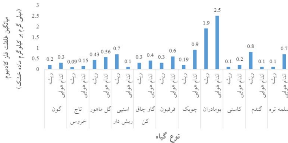
نمودار ۳. میانگین غلظت فلز کادمیوم در اندام هوایی و ریشه گیاهان آلوده به فاضلاب صنعت پتروشیمی رازی

چوبک و بومادران بترتیب ۴/۴ و ۳/۲ محاسبه شد. به عبارت دیگر برای گیاه پالایی فلز سرب، چوبک و بومادران بیشترین کارایی و برای تثبیت فلز در ریشه استپی ریش دار و گندم بیشترین کارایی را داشتند. برای گیاه پالایی فلز روی، چوبک و بومادران و برای استفاده در فرایند تثبیت فلز، استپی ریش دار و گندم بیشترین کارایی را داشتند. در مورد فلز کادمیوم، بومادران و تاج خروس در گیاه پالایی و در تثبیت فلز بومادران موفق تر از سایر گیاهان بوده است.