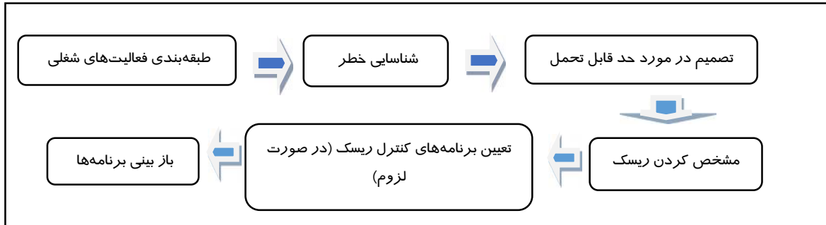
شکل ۲. مراحل انجام ارزیابی ریسک به روش HAZAN (۱۰)

سپس برای به دست آوردن درجه خطرزایی که مبنا و اساس مقایسه خطرات و اولویت‌بندی آنها جهت ارائه اقدامات کنترلی است، دو عامل شدت و تواتر حوادث،