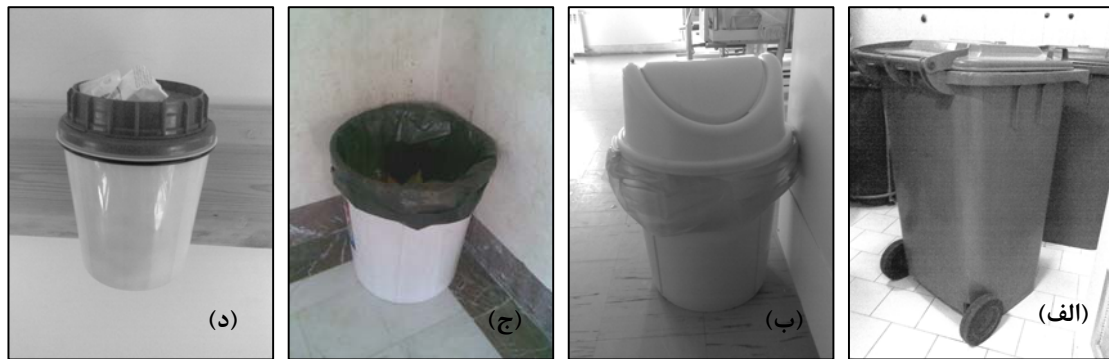
شکل ۱. انواع ظروف جهت ذخیره و جمع‌آوری انواع مواد زائد در بیمارستانهای مورد مطالعه: (الف) ترالی، (ب) سطل ذخیره زائدات عفونی و غیر عفونی، (ج) سطل ذخیره نان، (د) جعبه‌های ایمن جهت ذخیره وسایل نوک‌تیز

نیز مشاهده می‌شد، در سایر بیمارستانها موش وجود نداشت. گربه نیز در تمامی جایگاهها مشاهده گردید. فواصل و چگونگی شستشو و ضدعفونی وسیله جمع‌آوری زباله در جدول (۵) آمده است.