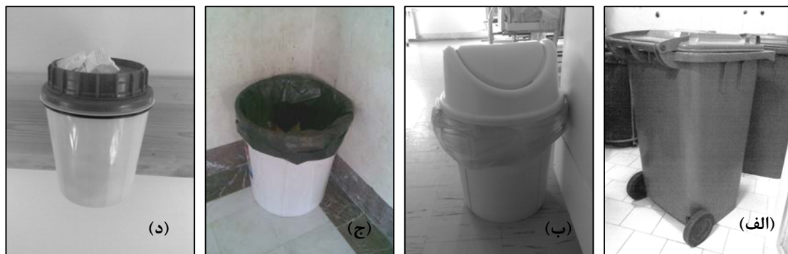
شکل ۱. انواع ظروف جهت ذخیره و جمع‌آوری انواع مواد زائد در بیمارستانهای مورد مطالعه: (الف) ترالی، (ب) سطل ذخیره زائدات عفونی و غیر عفونی، (ج) سطل ذخیره نان، (د) جعبه‌های ایمن جهت ذخیره وسایل نوک‌تیز

نیز مشاهده می‌شد، در سایر بیمارستانها موش وجود نداشت. گربه نیز در تمامی جایگاهها مشاهده گردید. فواصل و چگونگی شستشو و ضدعفونی وسیله جمع‌آوری زباله در جدول (۵) آمده است.