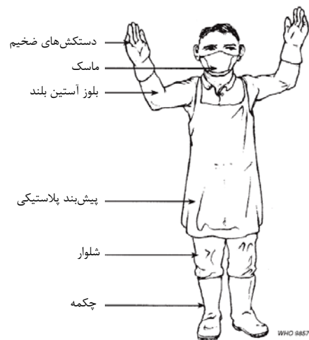
شکل ۳. تجهیزات حفاظت فردی توصیه‌شده برای کارگران مرتبط با حمل‌ونقل زائادات بیمارستانی [۱۷ و ۱۸]

بدینوسیله از مساعدت‌های مسئولان محترم بهداشت محیط بیمارستان‌های مورد مطالعه تشکر و قدردانی می‌گردد.