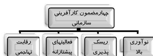
نمودار ۱. مضامین کارآفرینی سازمانی (۶)

نکته کلیدی برای حفظ سطح نسبتاً بالایی از کارآفرینی در داخل یک سازمان به درک ماهیت اساسی از تجربه کارآفرینی، شناخت پتانسیل ذاتی کارآفرینی همه کارکنان و ایجاد محیط کاری که به کارکنان اجازه بروز استعدادهای نهفته را بدهد بستگی دارد (۷) و کاربرد استراتژی‌های کارآفرینی به طور گسترده ای برای حل مساله رشد و مشکلات مربوط به عملکرد اقتصادی در محیط‌های کسب و کار بسیار رقابتی برای ثبات سازمانی توصیه می‌شود (۸). از سوی دیگر در حمایت از نفوذ اعتماد رابطه ای بر کارآفرینی سازمانی، نشان می‌دهد که اعتماد به نفع فرصت‌های سازمان برای قادر ساختن آن به فرایند تصمیم‌گیری اکتشافی است، که به نوبه خود باعث هوشیاری