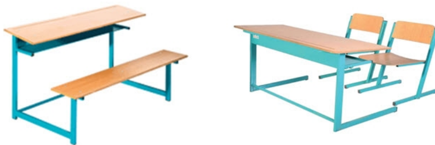
شکل ۱. نیمکت‌های رایج در مدارس

آسیب‌دیدگی در ناحیه مفصل ران و یا زانو، عدم تمایل آزمودنی به ادامه مشارکت در تحقیق) انتخاب شدند. ابتدا تمام دانش‌آموزان از نظر قوس کمری غربالگری شدند (با استفاده از صفحه شطرنجی و خط‌کش منعطف) و پس از شناسایی دانش‌آموزان دارای ناهنجاری جلسه‌ای توجیهی با حضور مدیر دبستان، دانش‌آموزان و اولیاء آن‌ها برای توضیح موضوع و اهمیت تحقیق و دعوت به شرکت در تحقیق تشکیل شد و در پایان ۱۲ نفر از دانش‌آموزان دارای لوردوز بیش از ۳۰ درجه علاقه‌مند به شرکت در تحقیق فرم رضایتنامه را با امضای اولیا پر کردند. در گروه سالم از ۱۲ نفر پس از پرکردن فرم رضایتنامه و فرم جمع‌آوری اطلاعات وارد تحقیق شدند. سپس تأثیر نیم ساعت نشستن روی دو نوع نیمکت به صورت جداگانه بر فعالیت الکتریکی عضلات منتخب گروه سالم و دارای لوردوز مورد بررسی قرار گرفت. اندازه‌گیری‌های تحقیق در شش روز و در هر روز ۴ نمونه انجام شد.