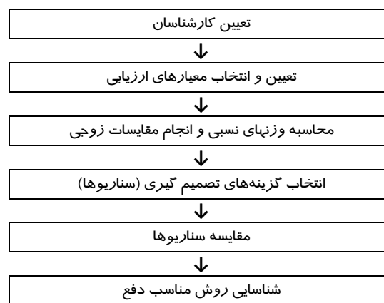
شکل ۱. مرور کلی چارچوب تصمیم‌گیری

این مطالعه از نوع توصیفی- کاربردی بوده و دارای دو مرحله اصلی بود. پس از تشکیل سلسله مراتب، در مرحله اول معیارهای ارزیابی با استفاده از مقایسات زوجی و با بکارگیری مقیاس ارجحیت ۹ تایی ساعتی تعیین وزن شد. در مرحله دوم مقایسات زوجی گزینه‌های تصمیم بر اساس معیارها صورت گرفت. برای مقایسه زوجی گزینه‌ها از اعداد (امتیاز ۱ تا ۹) استفاده شد. انجام هر دو مرحله با استفاده از روش تجزیه و تحلیل AHP صورت گرفت (۱۴). بررسی کلی از چارچوب تصمیم‌گیری در شکل ۱ نشان داده شده است.