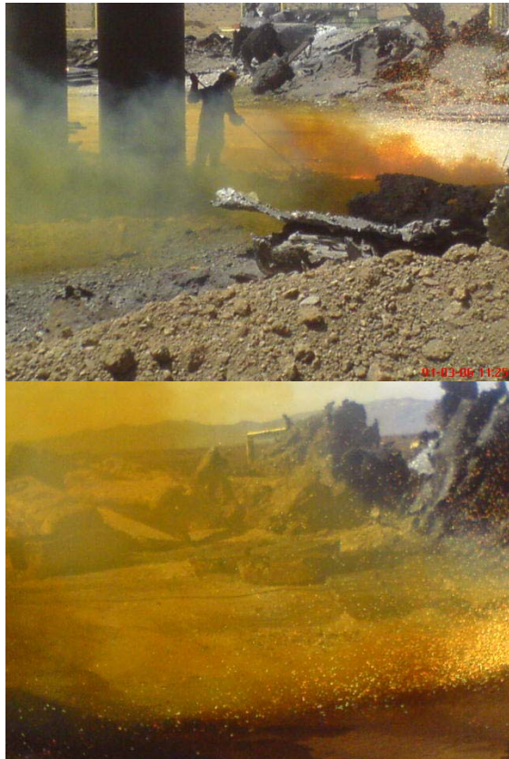
شکل ۱. تراکم بالای فیوم‌های ناشی از برش فلزات قراضه در واحد مورد مطالعه و نحوه مواجهه افراد

منطقه تنفسی کارگران مطابق روش ۷۳۰۰ و ۷۰۴۸ سازمان NIOSH انجام گرفت. دلیل انتخاب تمامی کارگران برای نمونه‌برداری، تنوع فلزات برش داده‌شده و فیوم‌های حاصله بوده است.