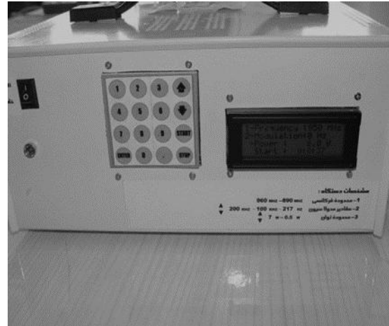
شکل ۱. نمایی از دستگاه مولد امواج ماکروویو. تصویر ماینیور و دکمه‌های تنظیم فرکانس و مدولاسیون امواج

همچنین بررسی مورفولوژی یا ریخت شناسی نمونه‌های اسپرم در ادامه آورده شده است (شکل ۳). همانگونه که در شکل نشان داده شده است سمت چپ اسپرمی از گروه نمونه می‌باشد که ساختار آن از حالت طبیعی خارج شده و دارای سر و گردن در هم تنیده می‌باشد و در مقابل، گروه کنترل که حالت طبیعی داشته و سر و گردن در امتداد بدن قرار دارند (نمونه شاهد سمت راست).